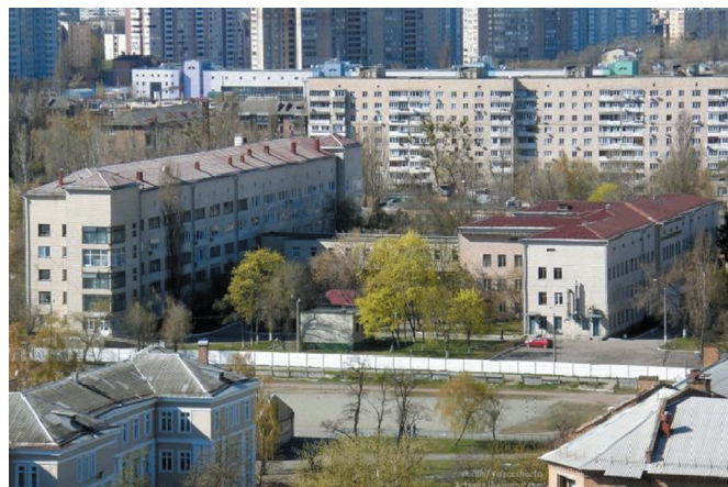
Узловая больница № 1