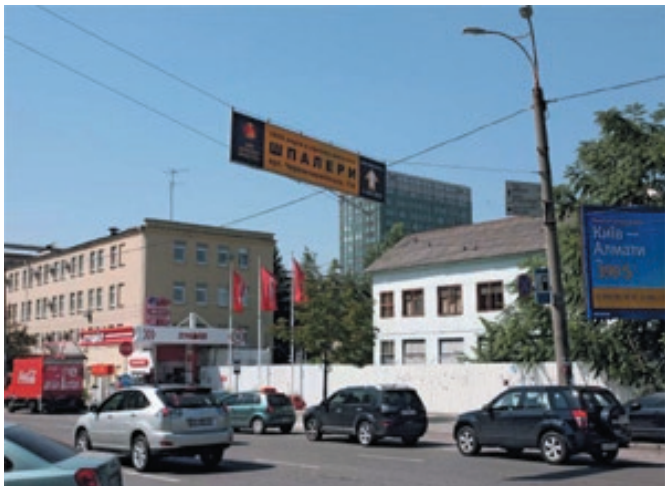
Помещение кафедры располагалось на 2-м этаже здания слева